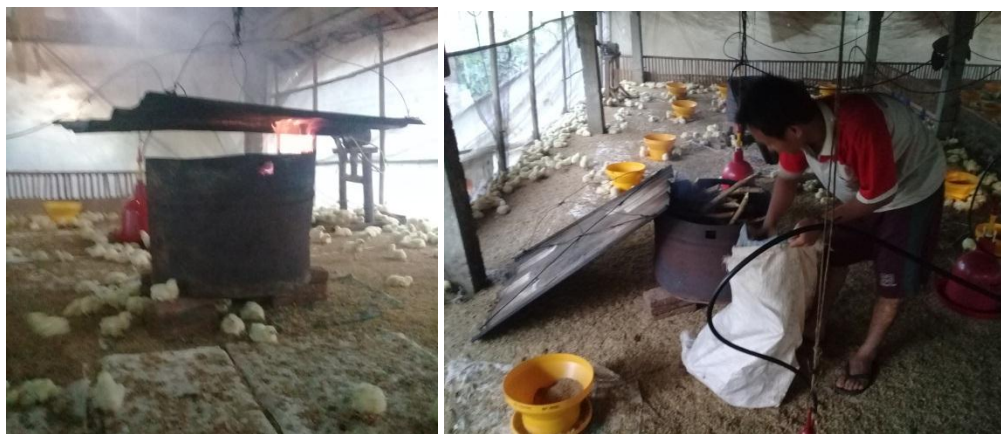
Gambar 2. Pengaturan suhu dan kelembaban kandang

Pengaturan suhu dan kelembaban kandang untuk masa brooding (umur 1-2 minggu) menggunakan panas dari kayu bakar yang ditempatkan dalam drum bekas yang diberi lubang. Dan suhunya dikontrol secara manual oleh anak kandang yang harus secara rutin dan sering masuk kedalam kandang untuk melihat kondisi ayam dalam kandang. Sedangkan untuk masa setelah brooding , pengaturan suhu dan kelembaban hanya menggunakan tirai penutup kandang yang diatur besar kecil bukaannya serta penyiraman air di sekitar kandang secara manual oleh anak kandang. Sehingga suhu dan kelembaban yang diharapkan tidak bisa terjaga dengan konstan. Dan sangat tergantung pada tingkat kerajinan atau frekuensi pengecekan oleh anak kandang.