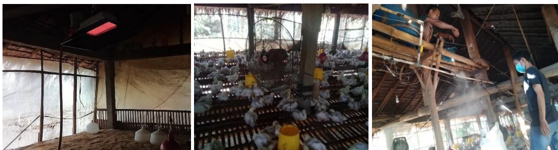
Gambar 4. Pendampingan pembuatan alat kontrol suhu dan kelembaban otomatis

Berdasarkan analisis situasi, permasalahan dan metode yang sudah dijelaskan sebelumnya, maka solusi untuk menyelesaikan permasalahan dapat diuraikan pada tabel 1 .