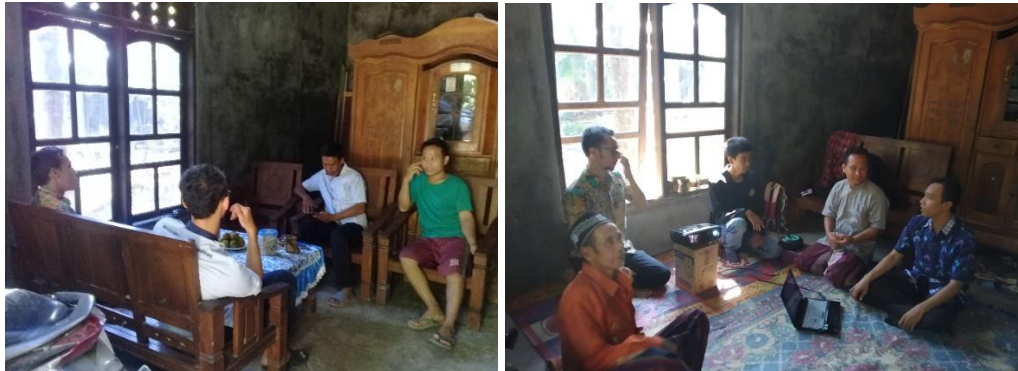
Gambar 3. Sosialisasi kegiatan dan pelatihan

Pendampingan dilakukan dengan mendampingi mitra dalam pembuatan alat kontrol suhu dan temperatur kandang secara otomatis, perbaikan atap kandang dan tirai, perbaikan sistem sanitasi dan drainase, perbaikan manajemen dan pembukuan.