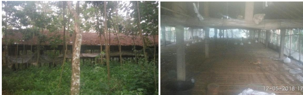
Gambar 1. Kondisi kandang ayam Bumiharjo Broiler

Kelompok usaha Bumiharjo Broiler ini mempunyai fasilitas 1 buah kandang untuk budidaya dengan kapasitas 2000 ekor ayam broiler. Dengan masa panen 35 hari berat badan ayam yang dihasilkan rata-rata 1,9 kg/ekor dan Feed Conversion Ratio (FCR) atau perbandingan antara jumlah pakan yang digunakan dengan jumlah bobot ayam broiler yang dihasilkan 1,6. Sistem budidaya sudah menggunakan sistem kemitraan, namun hasil panen masih belum dapat maksimal.