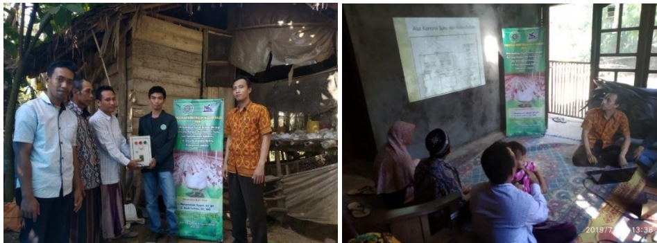
Gambar 6. Penyerahan alat kontrol suhu dan kelembaban otomatis (kiri) dan pelatihan penggunaan alat kontrol (kanan)