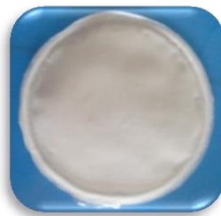
Gambar 1. Film transdermal diltiazem HCl

Hasil uji absorpsi lembab film transdermal F1 hingga F3 (kombinasi PVA dan EC 5:5) menunjukkan peningkatan sesuai dengan peningkatan kadar peningkat penetrasi PEG 400. Namun hal ini tidak ditunjukkan pada kombinasi PVA dan EC 7:3 (F4 - F6). Kemampuan film mengabsorpsi lembab menunjukkan