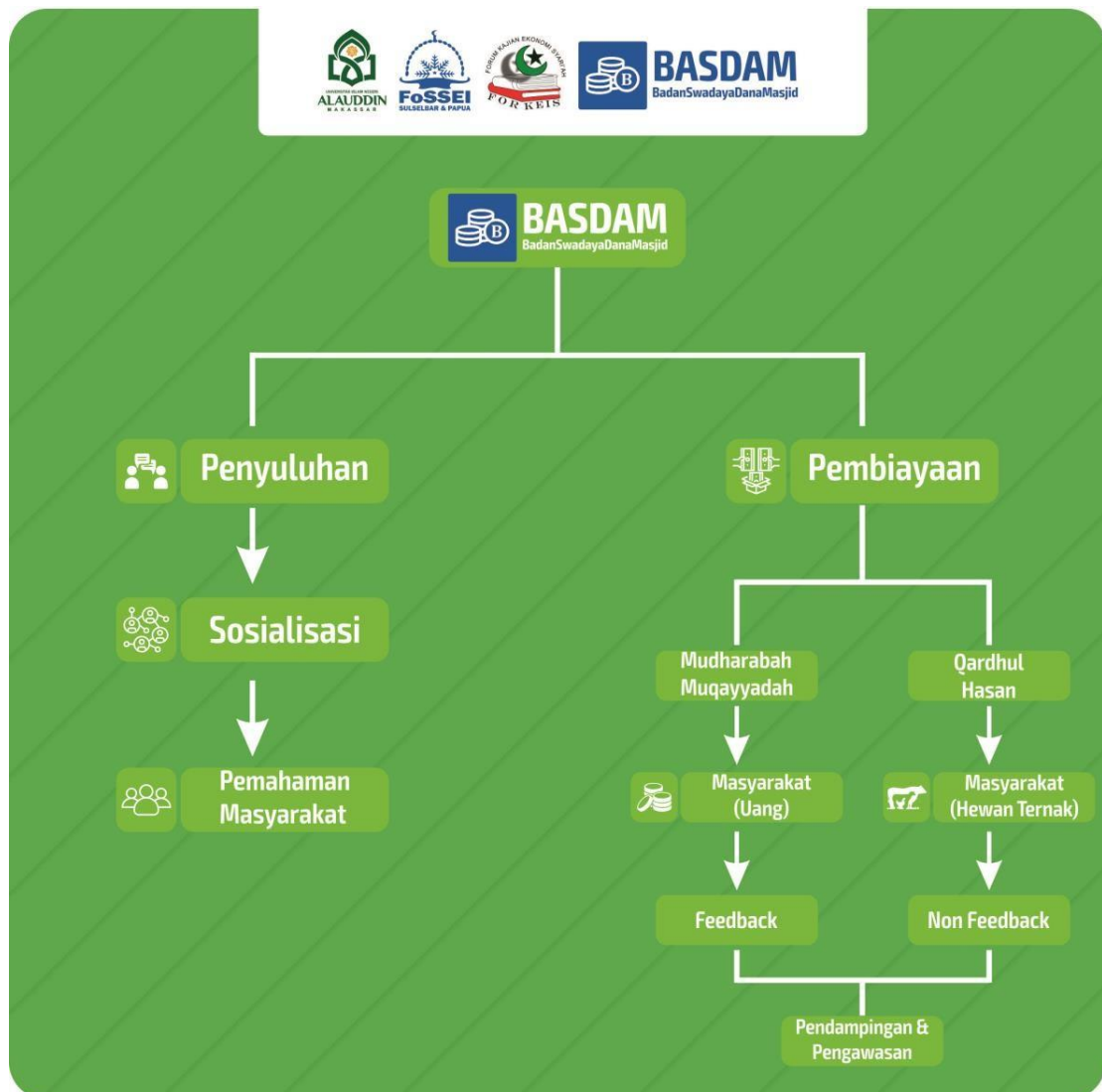
Gambar 1. 3 Skema Badan Swadaya Dana Masjid (BASDAM)

Ada dua akad pembiayaan yang digunakan yaitu, mudharabah muqayyadah dan pembiayaan lunak. Mudharabah Muqayyadah merupakan bentuk pembiayaan berupa uang yang diberikan kepada orang-orang yang terpercaya (amanah) dalam bentuk bagi hasil sehingga bisa lebih bermanfaat bagi masjid dan pihak penerima manfaat. Adapun syarat yang harus dipenuhi oleh para penerima dana adalah memiliki surat rekomendasi dari desa, berdomisili di sekitaran masjid dibuktikan dengan KTP dan syarat yang paling utama adalah melakukan sholat lima waktu dimasjid serta aktif dalam kegiatan masjid. Kemudian yang kedua adalah akad