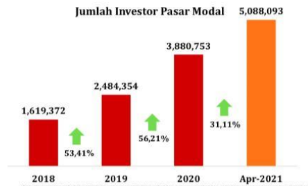
Gambar 1. Peningkatan Jumlah SID di Indonesia dari 2018-2021