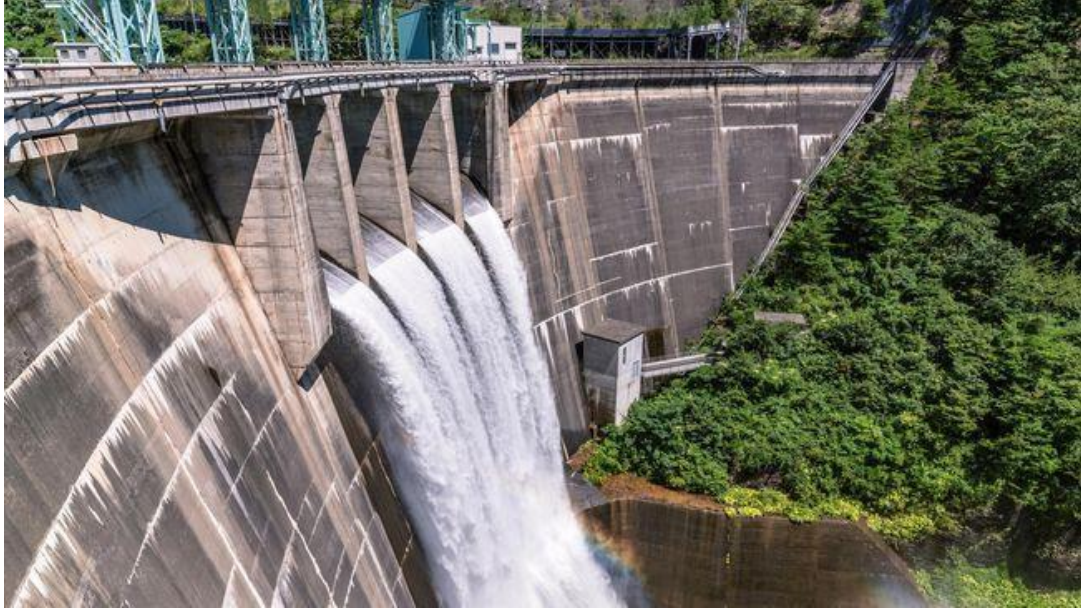
Gambar 3. Investasi Pembangkit Listrik Tenaga Air Tiongkok di Kalimantan Utara

nilai investasi Tiongkok hingga diperkerikan sebesar mencapai US$ 17.8 Miliar.