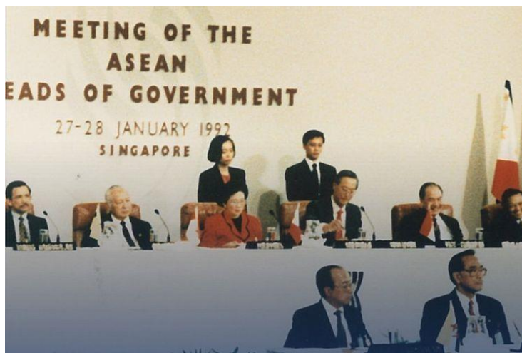
Gambar 1.2 Pembentukan AFTA di Singapura, 1992

Pada perkembangannya setelah terbentuknya kawasan bebas yang menarik beberapa mitra ASEAN, Negara Tiongkok adalah negara yang paling masif dalam perkembangan ekonominya. Setelah adanya Reformasi Deng Xio Ping pada tahun 1978 hingga 1989, Tiongkok menjelma menjadi negara yang sangat maju dalam aspek ekonomi perubahan signifikan ini terlihat dari pengembangan strategi – strategi kontemporer serta program dari restrukturisasi ekonomi. Sebelumnya negara Tiongkok memiliki sistem finansioal serta berbagai aktivitas ekonomi yang terpusat atau sentralisasi ke pemerintahnya saja hal ini dianggap tidak dapat memadai untuk menghadapi tantangan global. Setelah reformasi sistem keuangan dibenahi sehingga menempatkan sumber keuangan yang lebih besar kepada tangan – tangan individu maupun perusahaan dan membuka seluas – luasnya pasar tiongkok