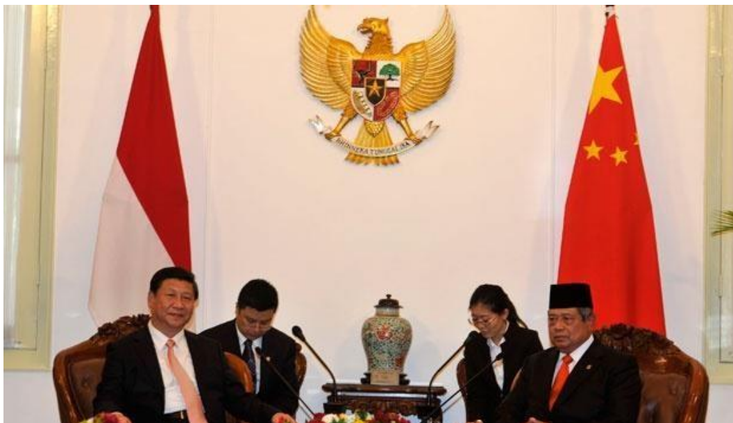
Gambar 3.1 Pembahasan ACFTA Kanan Presiden Tiongkok (Xi Jinping) – Kiri Presiden Indonesia (Susilo Bambang Yudhoyono)

Fokus Politik luar negeri di Indonesia pada Era Presiden Susilo Bambang Yudhoyono telah dilakukan dalam implementasi demokrasi demestik dengan slogan ‘ Thousand Friends, Zero Enemy ’ dalam perkembangan politik luar negerinya yang mencari teman diplomatik sebanyak – banyaknya dari berbagai negara di dunia dan sangat meminimalisir musuh – musuh apalagi memutus hubungan diplomatik. 8 Dengan slogan dari Thousand Friends, Zero Enemy tentunya sangat memiliki pengaruh kuat terhadap politik luar negeri yang pada akhirnya membuka peluang kerjasama dan diplomasi Indonesia didalam kancah internasional. Dalam hal ini juga mempengaruhi kerjasama dengan kesepakatan penandatanganan MoU ACFTA pada masa kepemimpinan dengan SBY – Tiongkok.