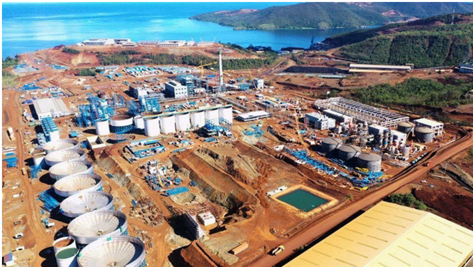
Gambar 3. Investasi Morowali di Sulawesi Tengah

Proyek Morowali yang merupakan sebuah perusahaan dari Tiongkok dengan Indonesia yaitu Shanghai Decent Investment Group yang terkenal pada Pengelolaan nikel serta baja. 9 Berkolaborasi dengan Perusahaan Indonesia yaitu Bintang Delapan Mineral. Proyek ini menelan sekitar US$980 Juta atau setara dengan hampir Rp. 14 Triliun akan membantu bangsa Indonesia untuk meningkatkan dari produksi bajanya hingga 2 sampai 3 juta Ton/tahun. Kawasan Morowali diharapkan dapat membuka jalan Indonesia untuk menjadi produsen Baterai Litium yang dapat dijadikan bahan mentah untuk Industri Mobil Listrik Lokal.