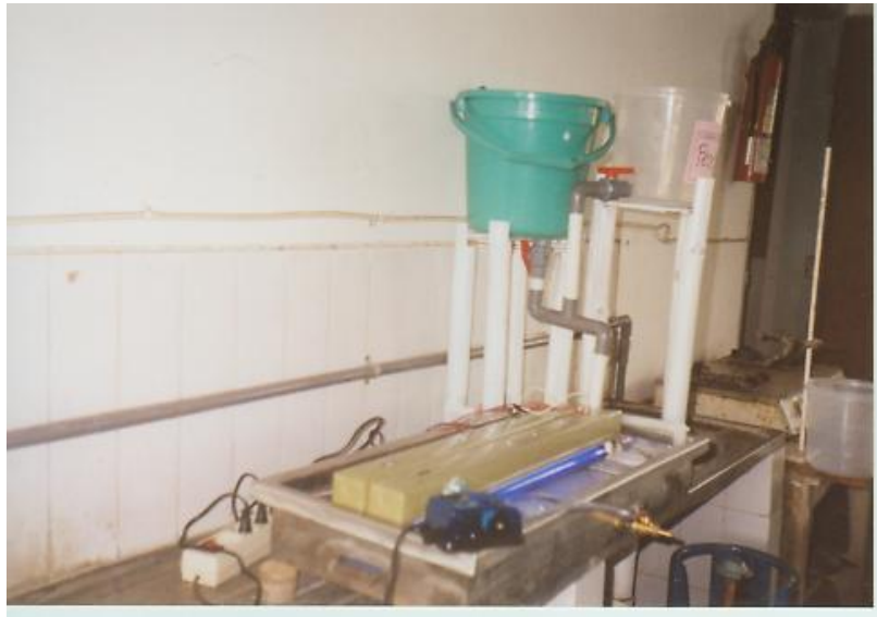
Gambar 1. Rangkaian alat percobaan

Langkah yang dilakukan dalam eksperimen adalah pertama, limbah sintetis dibuat dengan komposisi sesuai pada tabel 1 sebanyak 5 liter kemudian diaduk sampai larut lalu dianalisa kadar CODnya. Langkah selanjutnya adalah menimbang titanium dioksida ( \text{TiO}_2 ), kemudian melarutkannya sesuai dengan konsentrasi yang direncanakan yaitu 1g / 200 ml, 1g / 100 ml, 1,5g / 100 ml, dan 2g / 100ml. Selanjutnya, larutan titanium dioksida sebanyak 300 ml dimasukkan ke dalam limbah yang telah dituang ke Alat, kemudian diaduk. Semua perlengkapan alat dihidupkan, kemudian kran dibuka. Setelah sekat kedua pada reaktor penuh kemudian kran dimatikan, dan setelah 20 menit kran dibuka. Ini diulangi sesuai waktu yang ditentukan yaitu 40, 60, 90, 120, dan 180 menit. 6. Pengambilan sampel dilakukan setelah kran dibuka, kemudian kran ditutup saat sampel yang diperlukan sudah mencukupi. Langkah terakhir adalah pengambilan sampel dan sampel yang telah diambil kemudian dianalisa.