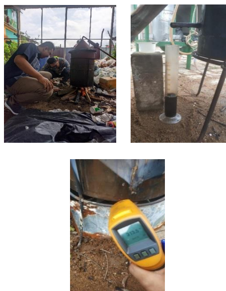
Gambar 4. Proses penelitian pembakaran menggunakan Kayu Bakar

durasi 40-50 menit hanya mengeluarkan air, dan pada proses menit ke 50 hingga 180 menit hanya menghasilkan uap dan tidak menghasilkan cairan berupa minyak, hal ini sesuai dengan hasil penelitian Lesmana et al , 2019 yang menyatakan bahwa sampah jenis PET tidak menghasilkan minyak melainkan serbuk berwarna kekuning-kuningan.