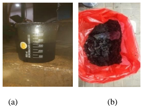
Gambar 2. (a) Hasil akhir pengolahan sampah LDPE berupa minyak (b) Char/arang sisa pembakaran

Untuk pengujian viskositas (kekentalan) bahan bakar minyak hasil pirolisis limbah plastik jenis PET termasuk dalam jenis minyak kategori mendekati solar karena hasil pengujian viskositas minyak pirolisis jenis plastik PET memiliki nilai viskositas 4.1 mm 2 /s sedangkan minyak jenis solar memiliki nilai 4.5 mm 2 /s.