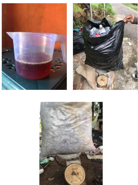
Gambar 3. Hasil akhir pengolahan sampah PET Berupa minyak

pirolisis, char dengan kata lain sisa plastik yang ada di dalam reaktor. Hal ini menjadikan bahan baku plastik LDPE layak untuk di jadikan bahan bakar alternatif pada penelitian lanjutan. Sebelumnya sampah plastik yang digunakan sebagai bahan baku adalah sampah plastik yang telah dicacah. Pemotongan sampah plastik bertujuan untuk mempercepat proses pirolisis. Karena semakin kecil luas permukaan maka semakin cepat reaksi pemanasan tersebut.