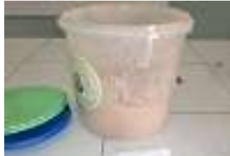
Gambar 1. Simplisia kulit durian

Kulit durian dikeringkan dibawah sinar matahari. Kemudian dihaluskan menggunakan crusher dengan screen 100 mesh, kulit durian yang sudah halus dan berbentuk bubuk disebut dengan simplisia.