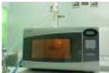
Gambar 2. Ekstraktor gelombang mikro (MAE)

Simplisia sebanyak 20 gr ditambah aquades 200 ml dan larutan asam (HCl, C_6H_8O_7 , H_2SO_4 , dan CH_3COOH ) dengan normalitas 1N dan 2N. Kemudian diekstrak dalam MAE dengan daya 10% selama 2 menit.