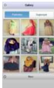
Gambar 4. Tampilan Halaman Menu Gallery

Halaman menu gallery ini berisi foto-foto dengan berbagai gaya berhijab. Pada menu ini, dibagi 2 pilihan kategori, yaitu kategori pashmina dan segiempat. Ini untuk membedakan foto-foto yang memakai kerudung model pashmina dan segiempat. Pada saat menu Gallery pada menu utama dipilih maka akan menampilkan pilihan sebagai berikut :