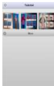
Gambar 6. Tampilan Halaman Menu Tutorial

Halaman menu tutorial ini berisi cara-cara penggunaan hijab yang sederhana. Pada menu tutorial ini terbagi 2 pilihan, yaitu tutorial foto dan tutorial video. Untuk membuka menu tutorial ini dibutuhkan koneksi internet.