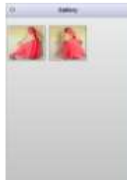
Gambar 5. Tampilan Halaman Menu Gallery

Pada halaman galeri ketika salah satu fotonya diklik, gambar tersebut akan pindah ke halaman baru, dan akan menampilkan foto-foto dengan model yang sama namun dengan gaya yang berbeda.