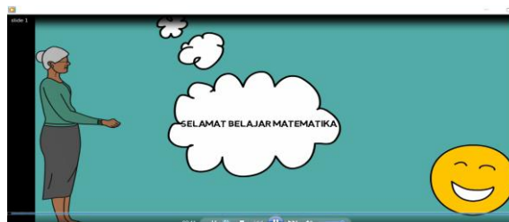
Gambar 5. Bahan Ajar berbasis video yang dikembangkan dengan Videoscribe