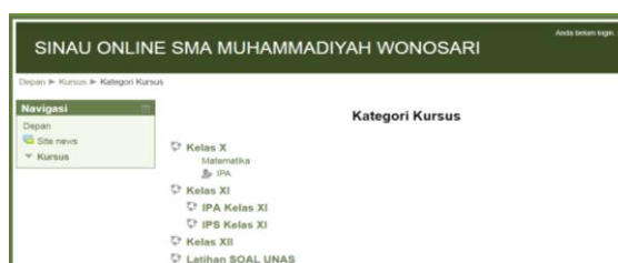
Gambar 1 Halaman depan elearning

Pengembangan elearning di SMA Muhammadiyah Wonosari dan SMA Negeri 2 Playen masih simulasi, Dengan simulasi ini diharapkan guru sudah mempunyai gambaran bagaimana pemanfaatan elearning baik sebagai proses distribusi materi bahan ajar maupun dalam pembuatan soal berbasis TIK. Halaman depan elearning dibedakan dibagi menjadi menu mata pelajaran sesuai kelompok, bidang keahlian dan soal ujian serta mata kuliah per kelas. Gambar 1 merupakan tampilan depan elearning SMA Muhammadiyah Wonosari.