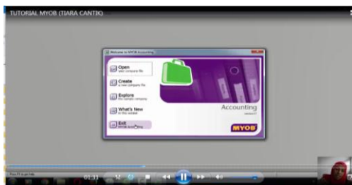
Gambar 6. Bahan Ajar berbasis video yang dikembangkan dengan Camtasia