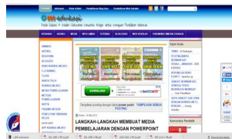
Gambar 4 Link m edukasi

Bentuk materi bahan ajar dan bahan ujian yang diberikan siswa dibedakan :