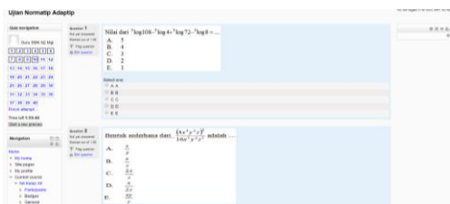
Gambar 2 Soal Ujian

Penggunaan TIK dalam pembuatan soal ujian dapat menggunakan aplikasi quizcreator dan mengoptimalkan Moodle. Elearning yang dibangun, disamping menyediakan materi ajar juga akan menyediakan soal-soal ujian berbasis TIK. Kelebihan dari soal ujian berbasis TIK ini, guru dapat mengatur/memanajemen dari tipe soal dan siswa dapat mengerjakan soal latihan UNAS secara online ataupun dikerjakan di laboratorium secara intranet.